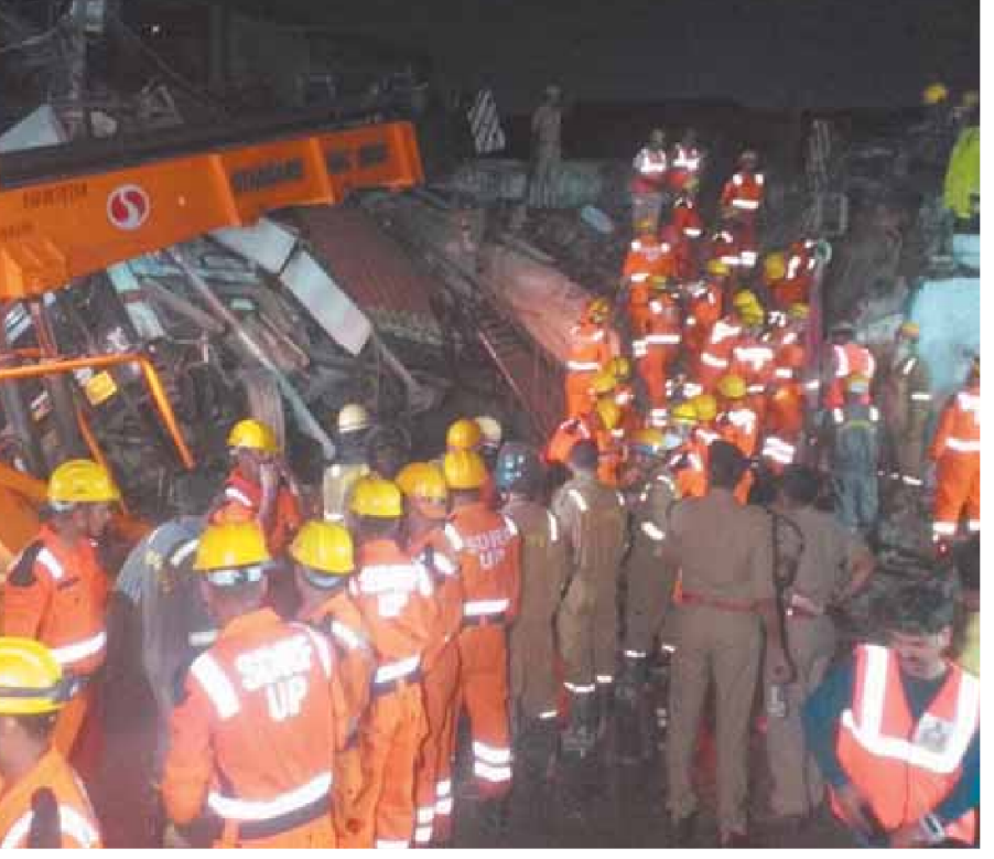
Rescue operation underway at the building collapse site; people injured in the incident at Lok Bandhu Hospital

Reports suggest that a truck collided with the building